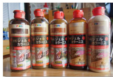
ジェルカラーニス(全 10 色) 5色を試し塗りしてみました (アサヒペン社製)

塗膜は出来ませんが、光沢仕上げではなく、しっとり落ち着いた印象で、作品を手アカや汚れから保護できます。