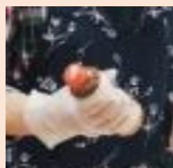
上下回転、よく振る